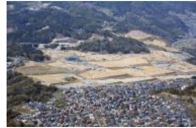
URの保留地が残った彩都の東部地区 （大阪府茨木市）

URは「（企業などの）土地区画整理の事業化に向けて頑張る」と、将来の土地売却を模索している。新名神高速道路が近くを通過しているものの、東部は鉄道の駅から離れている。都心居住の流れもあり、宅地需要は見込みにくい。